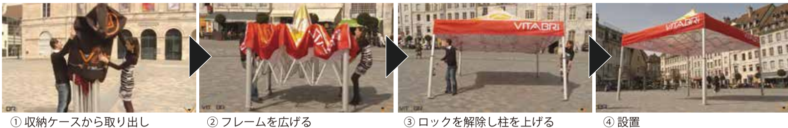
① 収納ケースから取り出し ② フレームを広げる ③ ロックを解除し柱を上げる ④ 設置