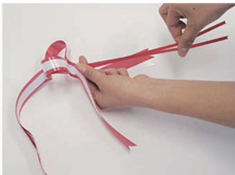
② 細い方のリボンを、ゆっくり一段階ずつ引っ張って下さい。 その時写真のように、もう片方の手でリボンを支えて下さい。