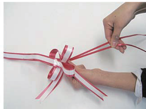
③ 失敗しても元に戻してやり直す事が出来ます。