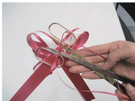
⑤ ハサミの柄にしっかり結びつけて下さい。