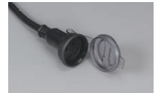
連結点灯専用コンセント