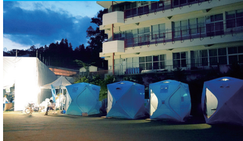
豊野西小学校におけるシャワー利用

台風 a19 号で水没した長野市西部において、WOTA BOX を利用した簡易シャワー施設を設置。下水復旧までの約 2 カ月間、緊急で避難所 6 カ所に合計 14 台を納品。