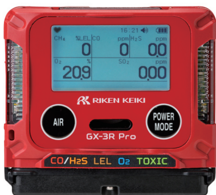
ポータブルガスモニター GX-3R Pro