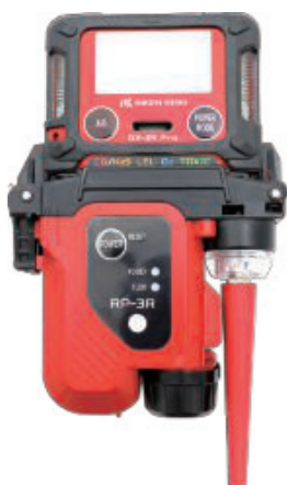
ポンプ吸引ユニット