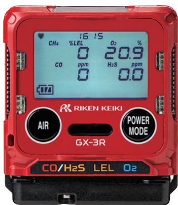
ポータブルガスモニター GX-3R (TYPE A / E)