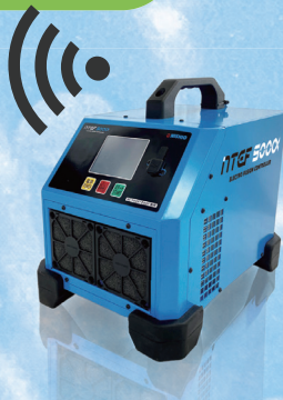
「融着作業ガイダンス」アプリケーション (iOS,Android アプリケーション)