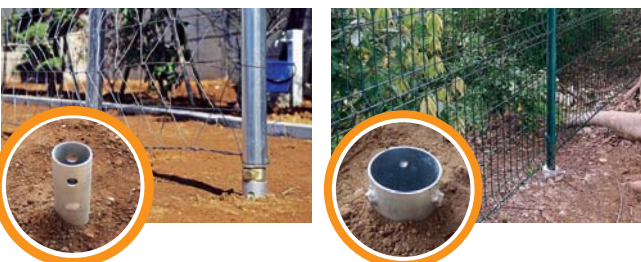
単管接続用 Tタイプ