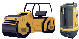
転圧管理システム