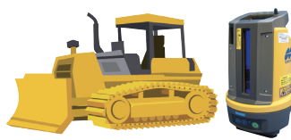
排土板支援システム (ブルガイド)