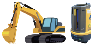
ミニバックホウ 排土板支援システム