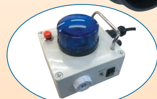
無線受信コントロールBOX “音と光で周囲に警報”