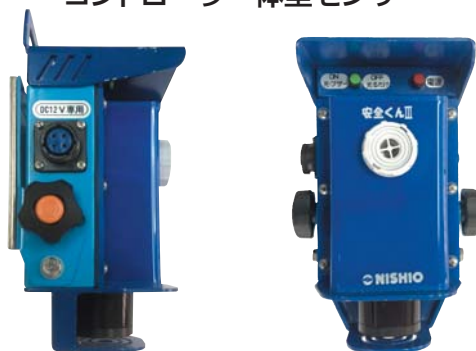
コントローラー一体型センサー