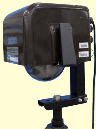
専用三脚(オプション品)