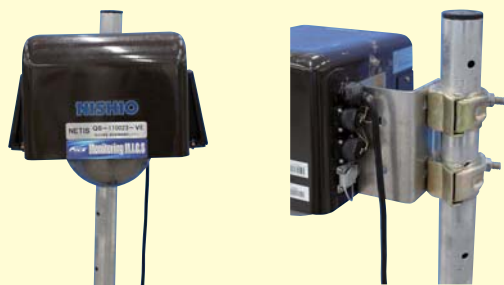
単管パイプ用取付金具(標準装備)