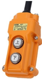
有線タイプ用ペンダント

手で持ち運べるホイスです。 操作性が良く、安全機能も充実しています。 有線タイプ、無線タイプがあります。