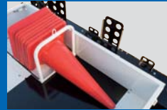
カラーコーン収納