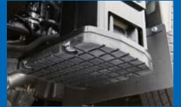
ゴム付パッドベース