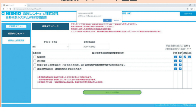
帳票ダウンロード画面