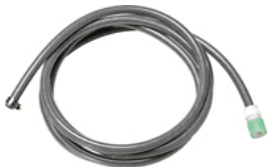
給水ホースセット Digi Mist (5m ホース、水道パチット付き)