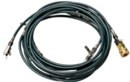
標準高圧ホースセット Digi Mist