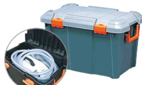
保管に便利なソリッドコンテナ付 (ブラケース)