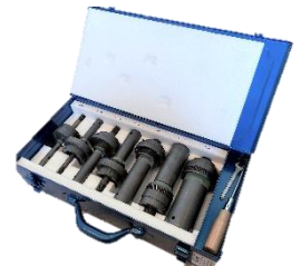
●拡管アタッチメント (13~60Su)