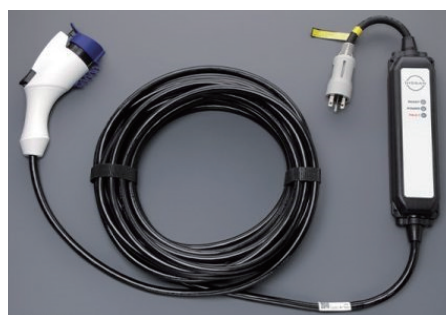
普通充電用ケーブル付 (7.5m、200V用)